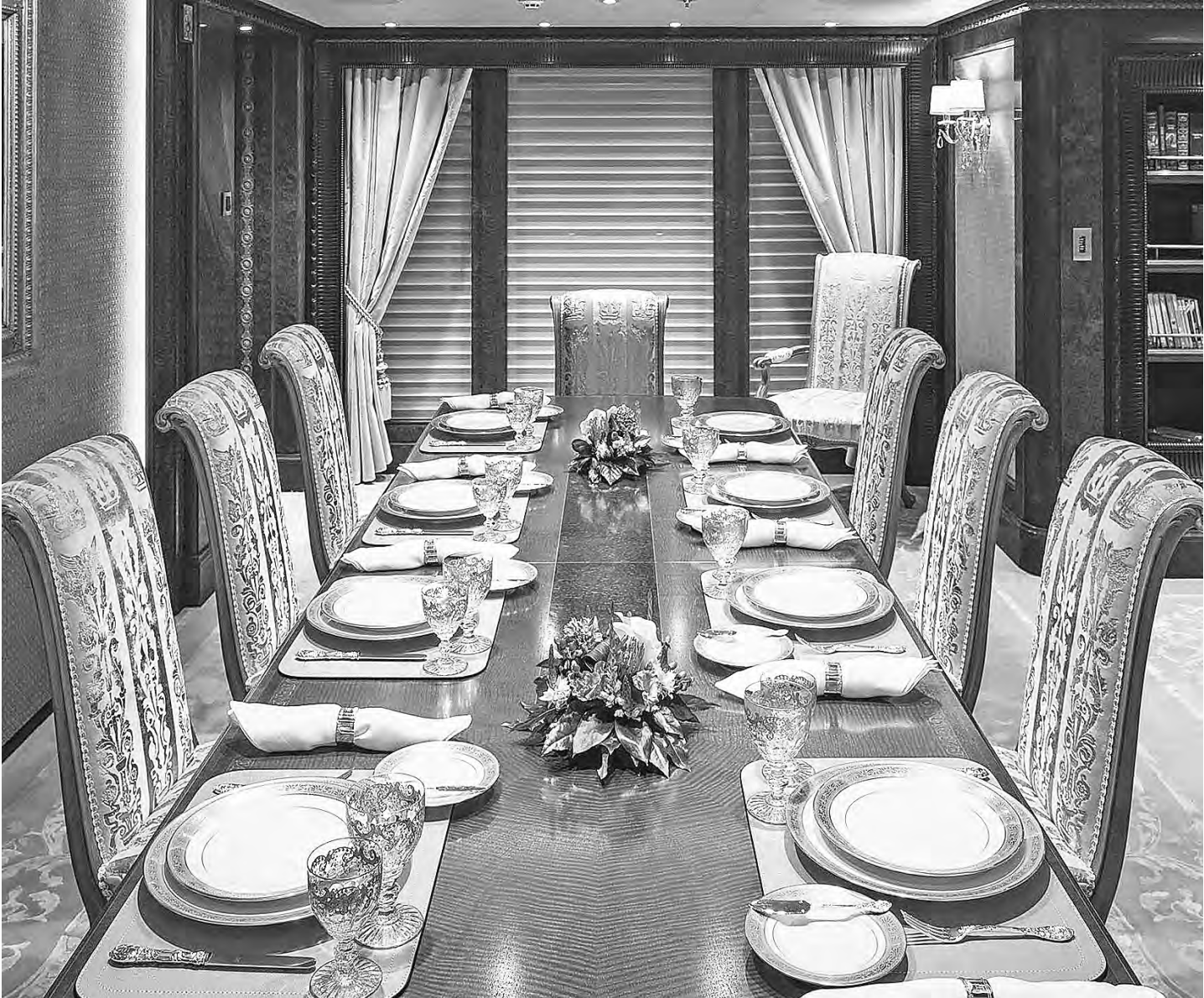
Кают-компания на яхте Ester III, принадлежащей сбежавшему в Монако совладельцу Внешпромбанка Георгию Беджамову. Яхта выставлена им на продажу за 79,5 млн евро.

На живых аукционах, «под молоточек», в отличие от электронных торгов, дух соревнования всегда ощущается сильнее. Поэтому, полагаем, финансовая отдача от каждого проданного актива будет больше. Для удобства покупателей мы арендовали специальную площадку для проведения аукциона, организовали систему правильного хранения и учета имущества. На все лоты перед стартом аукциона можно будет посмотреть, оценить, в каком они состоянии, и прицениться. Одно дело покупать по картинке или по опубликованным характеристикам, другое — когда ты видишь наглядно реализуемое имущество и можешь убедиться в его исправности, что немаловажно, когда речь идет, к примеру, об оргтехнике. Это же гораздо лучше, чем приобрести «кота в мешке».