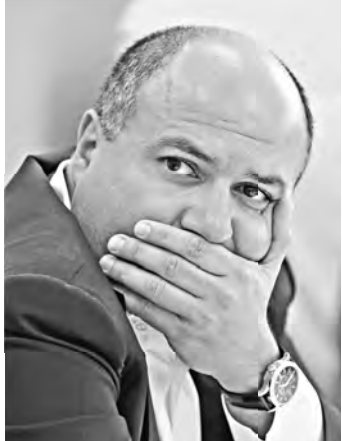
Внешпромбанк, совладельцем которого был Георгий Беджамов, поставил рекорд по «дыре» в капитале — 210 млрд рублей.

БЕЗОПАСНОСТЬ Условия хранения гражданского оружия предлагают пересмотреть