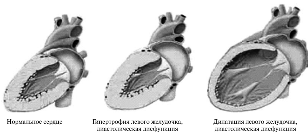
Рис. 1. Ремоделирование сердца при гипертонической болезни.