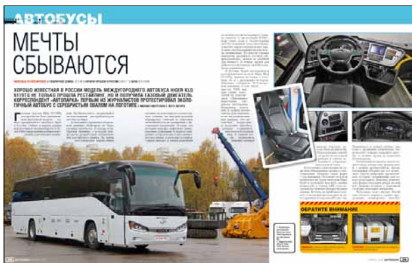
HIGER KLQ 6119TQ MY2022