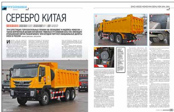
SAIC-IVECO HONGYAN GENLYON 6X4, 8X4