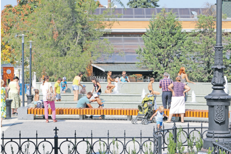
Власти Симферополя считают, что горожане «обустроили аквапарк» в центре города.