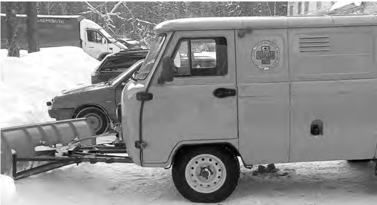
Модернизированная техника помогает очищать от снега территорию Томской районной больницы.