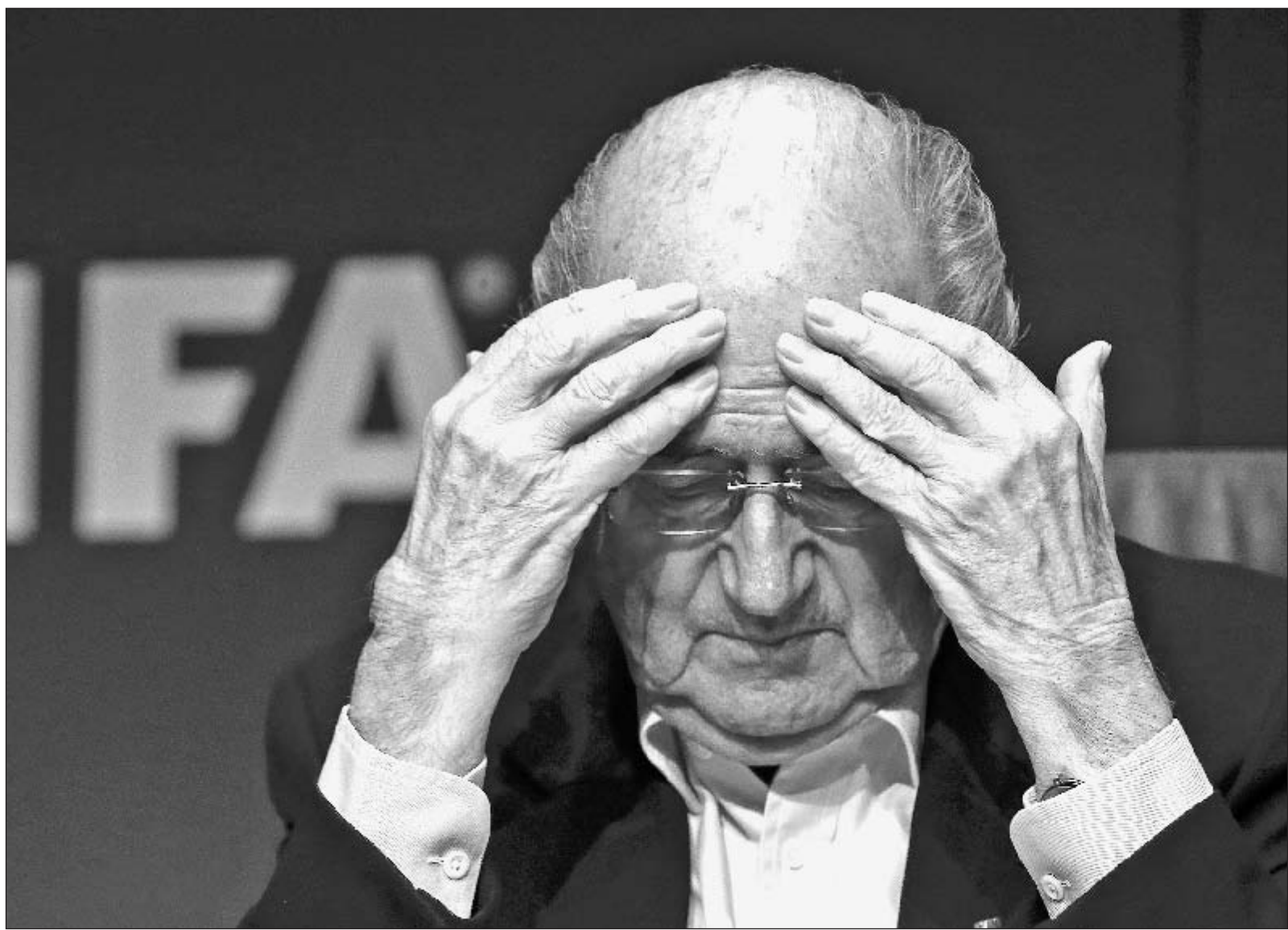
Зепп БЛАТТЕР больше не может рассчитывать на союзников из Европы. Но для переизбрания в президенты ФИФА может быть достаточно и других голосов.

Сегодня в Цюрихе состоятся выборы президента ФИФА - Зеппу Блаттеру противостоит иорданский принц Али бин Аль-Хусейн. А накануне международный футбол потряс беспрецедентный коррупционный скандал. Президент УЕФА Мишель Platini даже не исключил, что возглавляемая им организация выйдет из ФИФА.