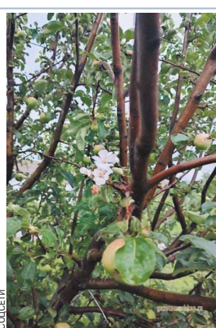
Получается, что растение потратит все силы на вегетативный рост совершенно напрасно.

Сейчас Тулянинов планирует попытаться восстановить хотя бы немного свое зрение — до тех самых 0,04%, которые у него были.