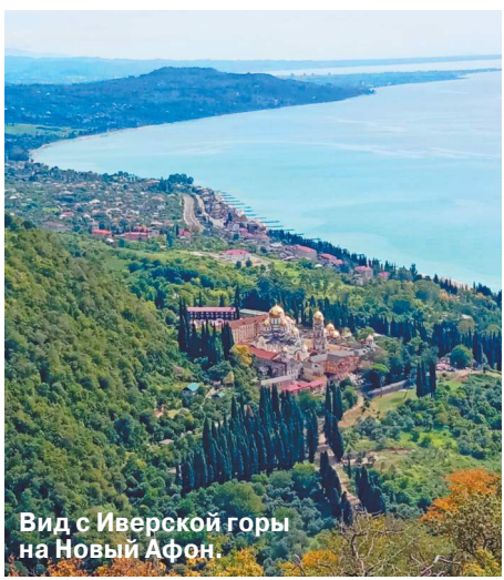
Вид с Иверской горы на Новый Афон

В городе Смела Черкасской области ликвидировано здание технологического колледжа, где размещались новобранцы ВСУ и их иностранные инструкторы.