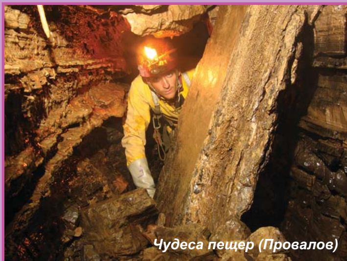
Чудеса пещер (Провалов)