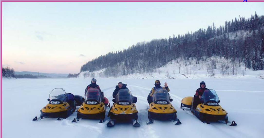
На старте к вершинам