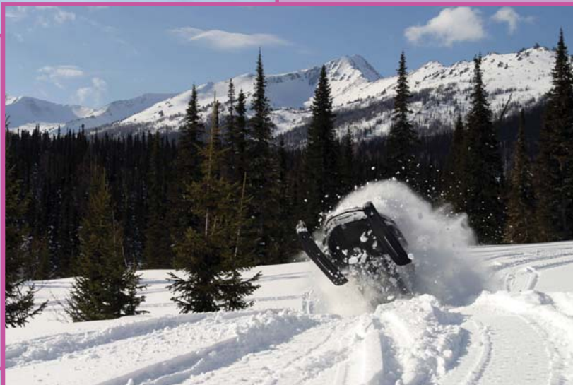
Полярное кольцо (Чуков)