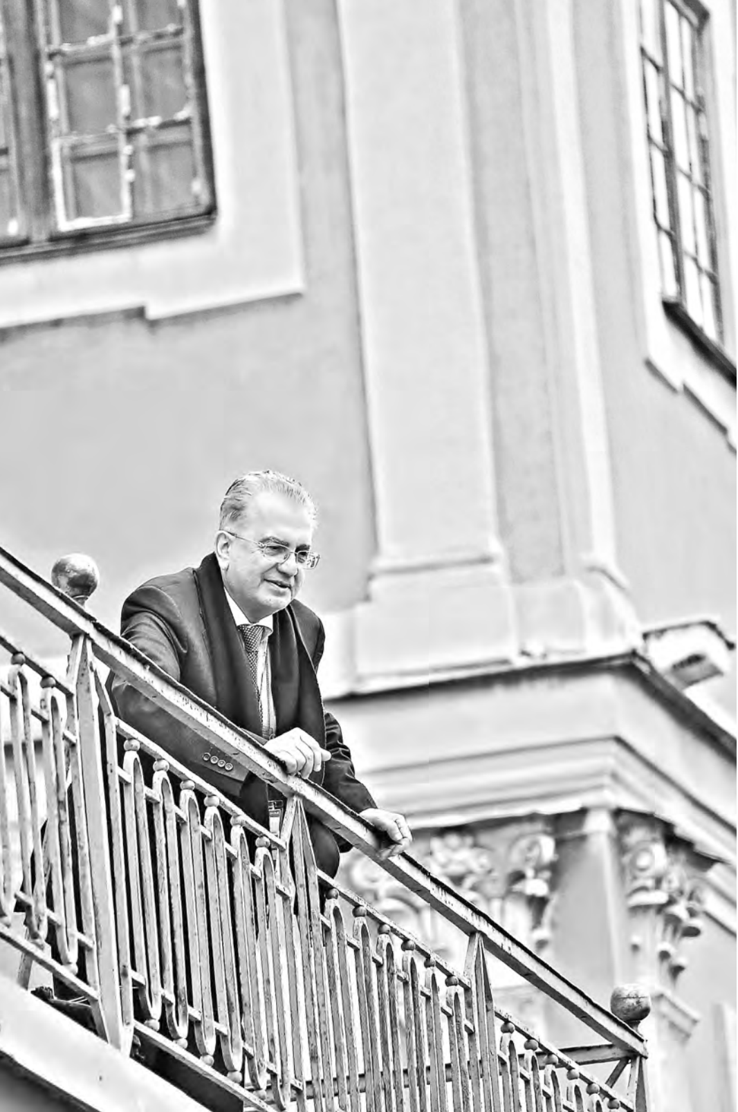
Михаил Пиотровский считает, что знание должно помогать людям жить вместе, а не оказываться полем вражды и провокации.

В День знаний стоит вспомнить, что объективное знание в первую очередь несут людям музеи, хранители подлинных вещей, в которых живут память и стимул к размышлению.