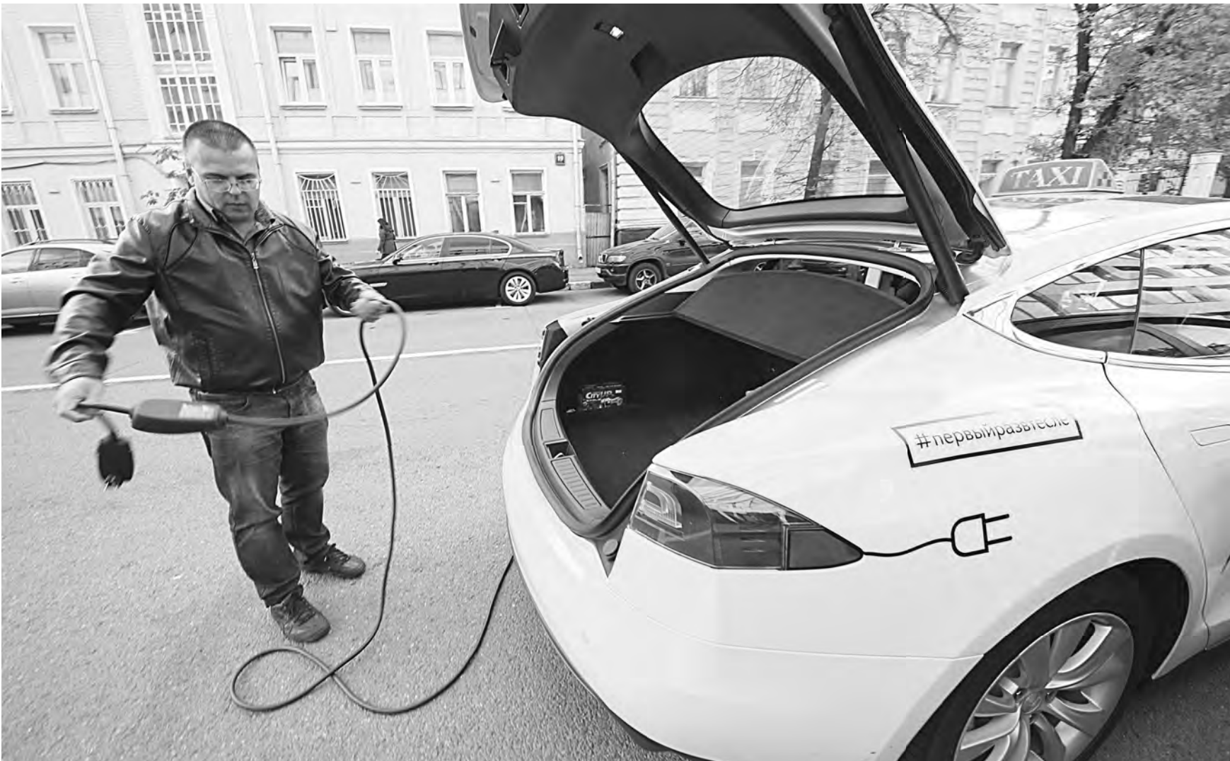
СЕРГЕЙ МАКЕДАНСКИЙ / ТАСС

207 крымских отелей и санаториев вошли в пятый этап программы туристического кешбэка, который продлится до 12 апреля 2022 года. Сейчас ее участников стало в 2,6 раза больше, чем на первом этапе.