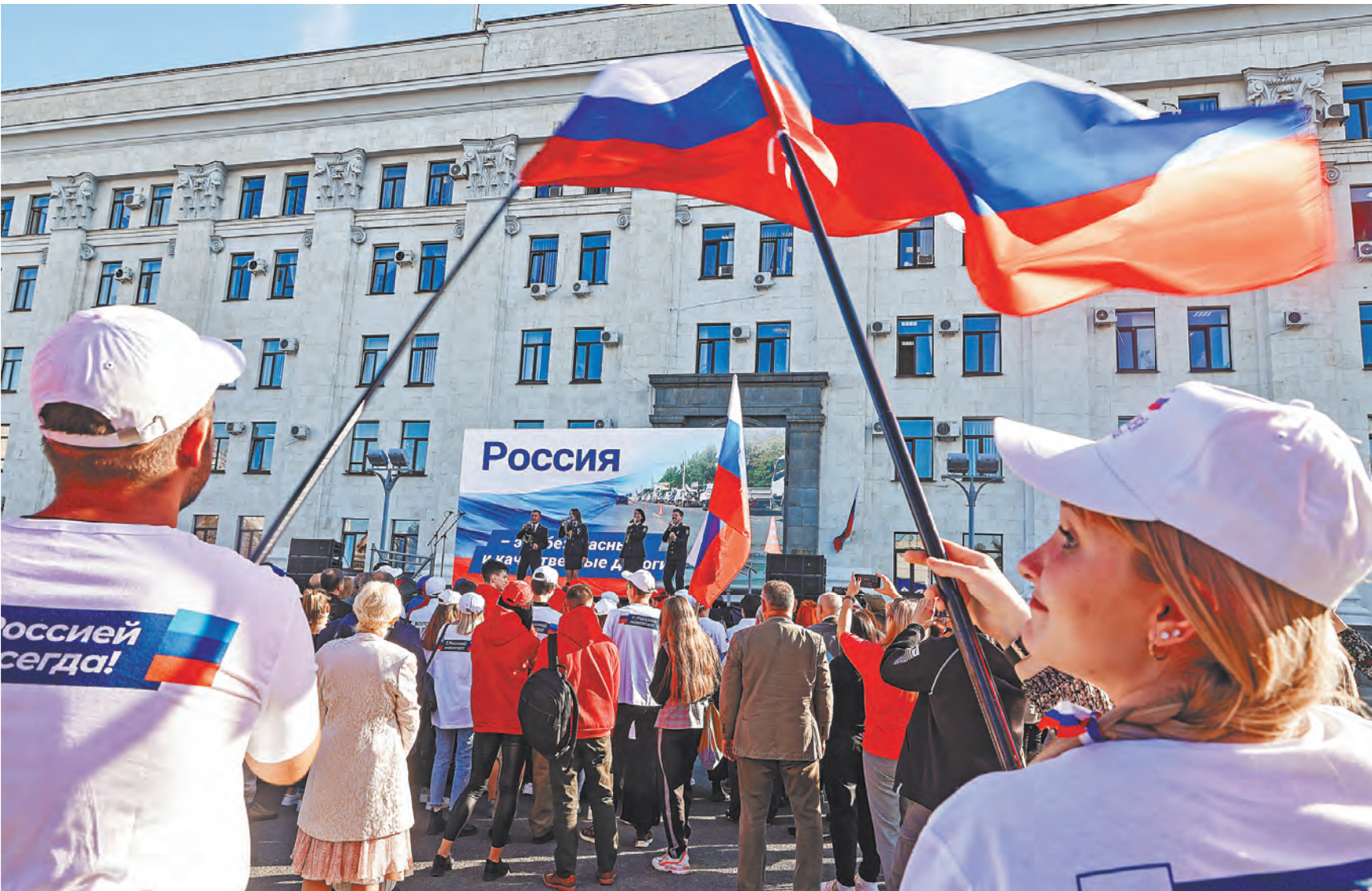
Жители освобожденных территорий сделали свой выбор — стать частью нашей большой страны.

Гражданам России, проживающим на территориях ДНР, ЛНР,