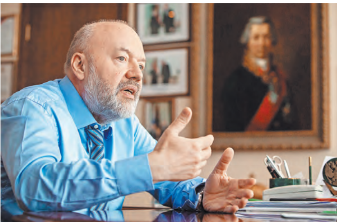
Павел Крашенинников: Законопроекты закрепляют социальные гарантии жителей новых регионов.