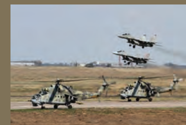
СООТВЕТСТВОВАТЬ СОВРЕМЕННЫМ РЕАЛИЯМ