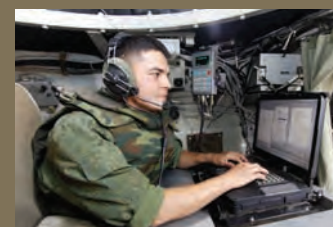
АСУ БАТАЛЬОНА В БОЮ