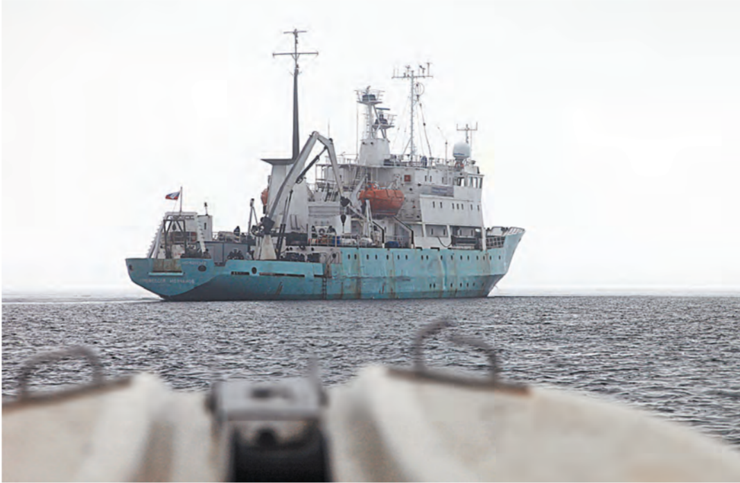
Экспедиция по очистке Арктики от промышленных отходов на архангельском судне «Профессор Молчанов».