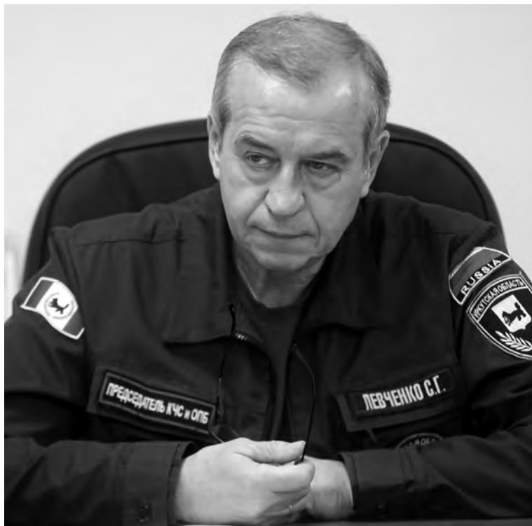
АДМИНИСТРАЦИЯ ИРКУТСКОЙ ОБЛАСТИ

На совещании стало понятно, что с этой, казалось бы, непосильной задачей власти справились. Вице-премьер, председатель правительственной комиссии по ликвидации последствий паводка Виталий Мутко отметил, что в целом в 135 населенных пунктах, пострадавших от наводнения, жизнедеятельность восстановлена. Социальные выплаты по 10 тысяч рублей и компенсации за утрату имущества получили более 46,5 тысячи человек. Оперативно и четко сработали суды: за три с небольшим месяца они рассмо-