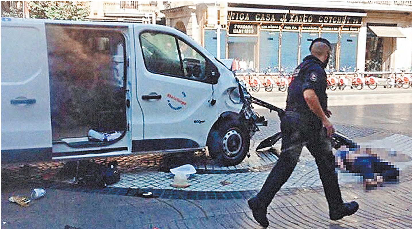
Белый микроавтобус в руках террориста становится не только транспортным средством повышенной опасности, но и орудием массового убийства.