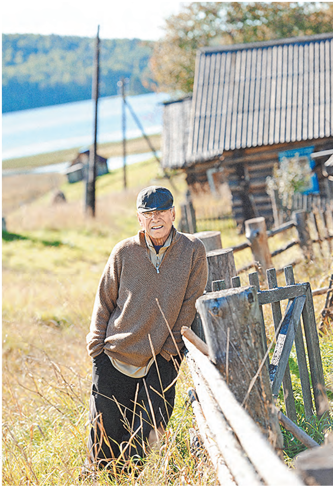
Андрей Кончаловский на съемках фильма «Белые ночи почтальона Алексея Тряпицына» (2014).

Поэтому ему, изысканному европейцу и глубоко русскому