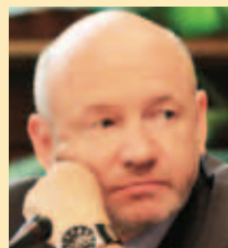
24 декабря Платонова Владимира Михайловича, председателя «РКС-Москва», председателя Московской городской Думы