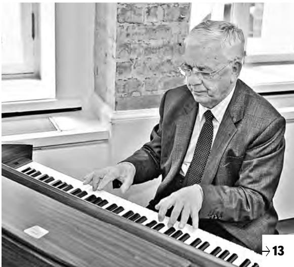
Евгений Евтушенко — Раймонду Паулсу МОЛЧАЛИВЕЙШИЙ ЧЕЛОВЕК

Когда Паулс играет Паулса, под руками — из клавиш прибор. Трепет лермонтовского паруса поднимает нас всех над собой.