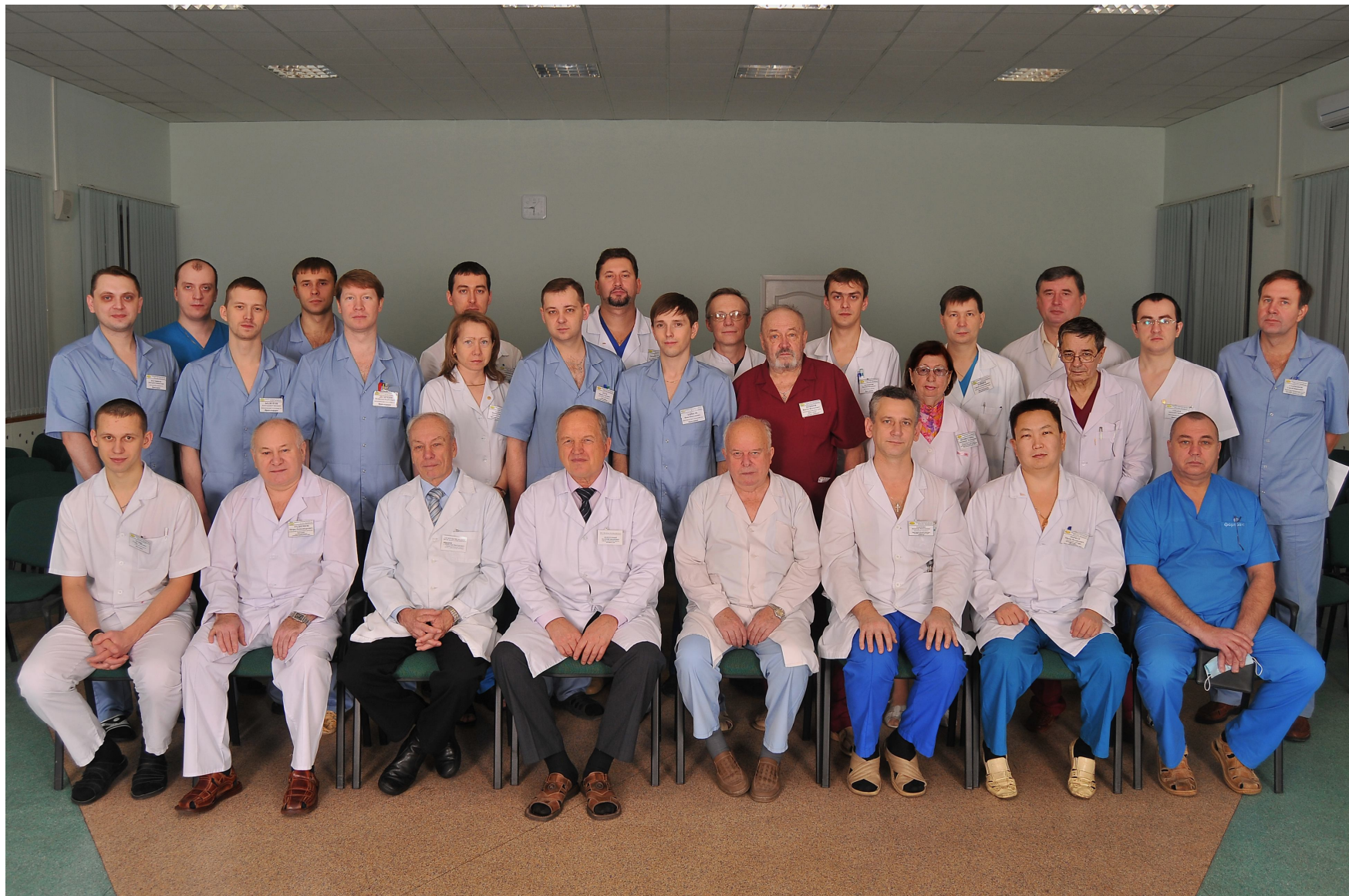
Коллектив клиники, 2010 год