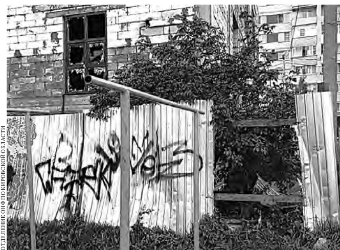
Пройти в заброшенное здание на улице Чернышевского, 22 труда не составит.

По двум объектам — на улице Чернышевского, 22 и на улице Мичуринской, 3 — общественники направили обращение в прокуратуру.