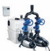
Multilift Комплектные канализационные насосные установки