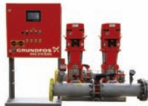
Hydro MX Комплектные насосные установки со шкафом управления Control MX для систем пожаротушения