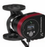
MAGNA3 Циркуляционные насосы с «мокрым» ротором