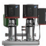
Hydro Multi-E Установка повышения давления с частотными преобразователями на каждом насосе