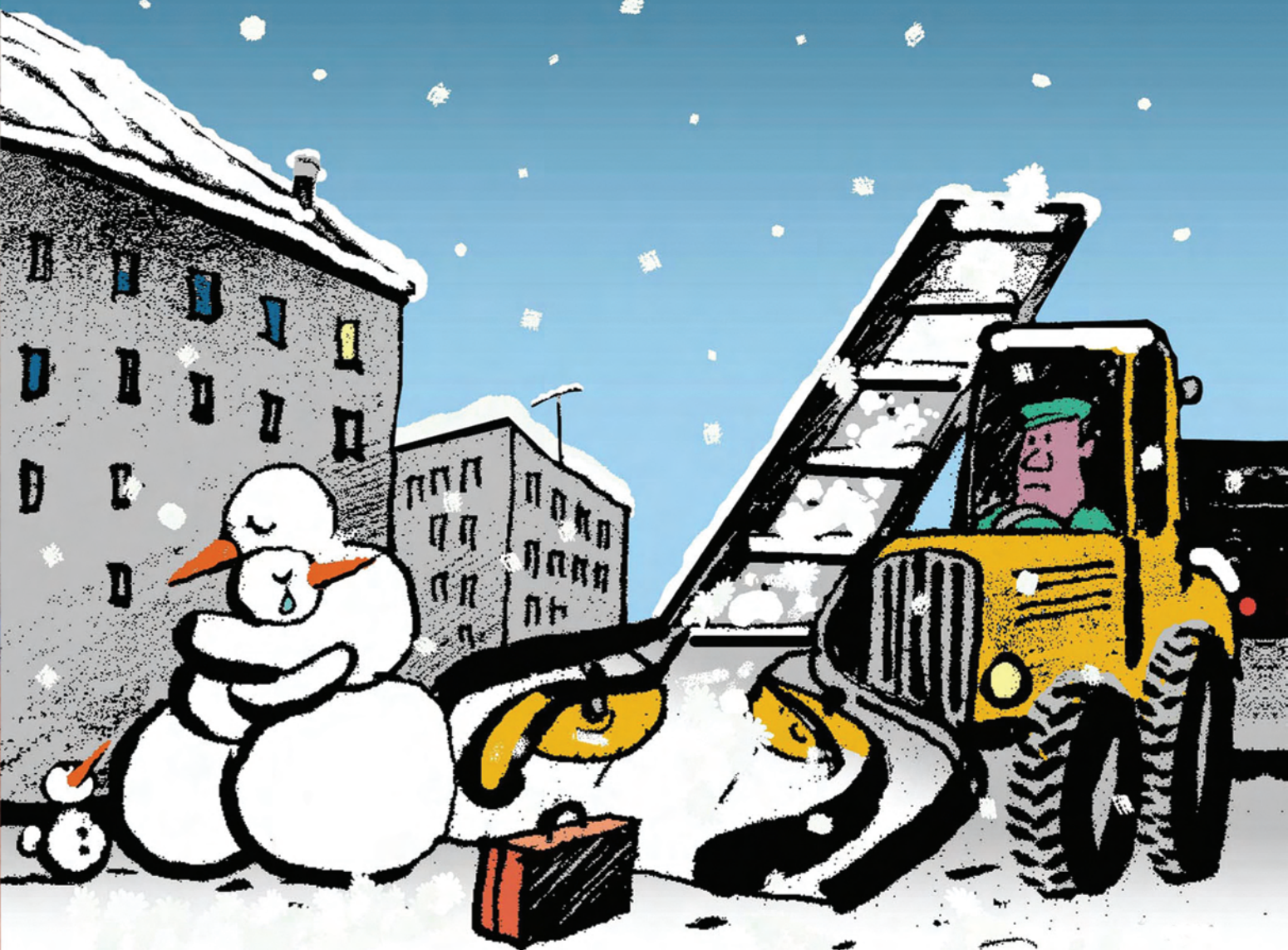
Рисунок Александра Сергеева cartoonbank.ru