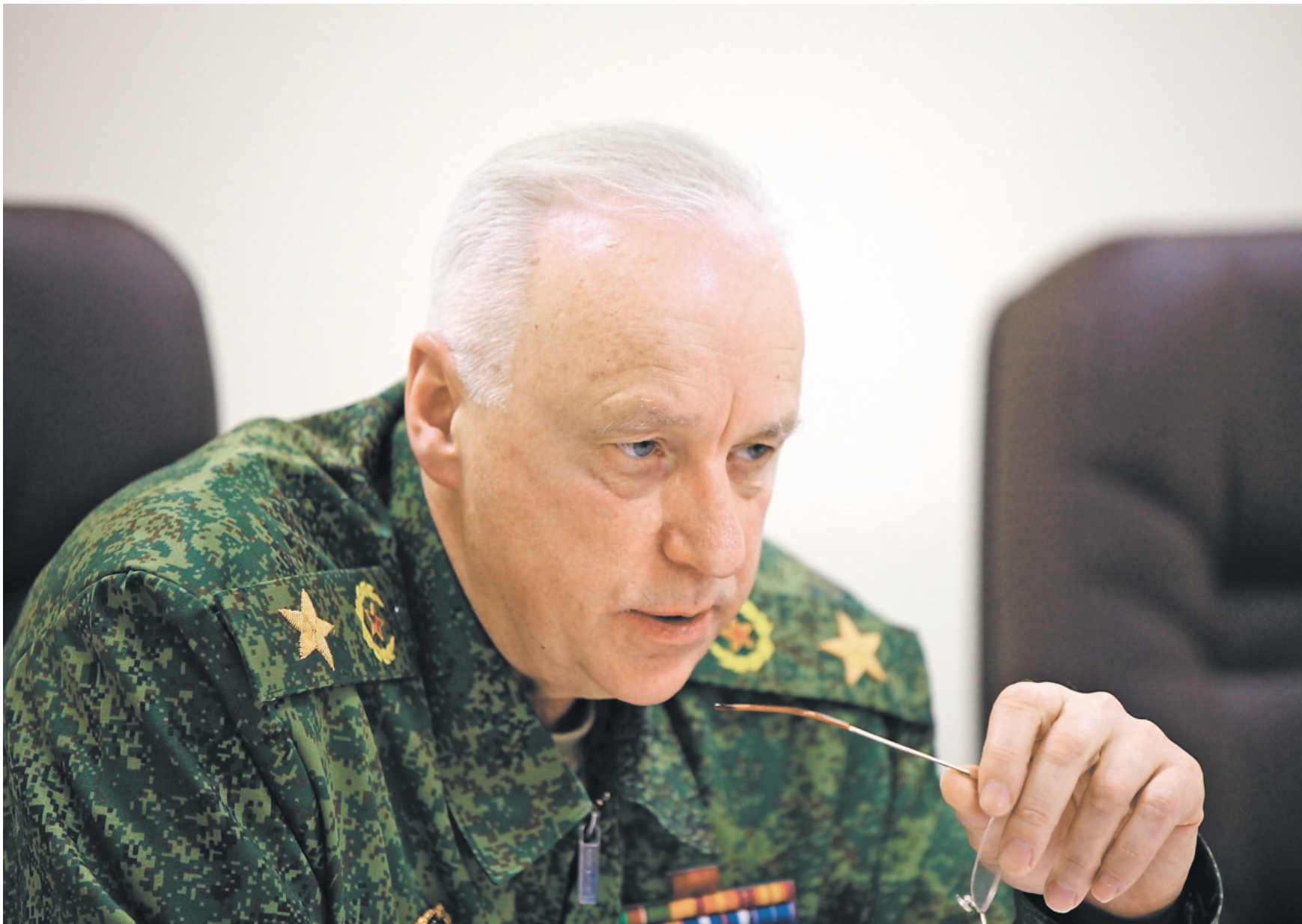
ПРЕДСТАВЛЕНО СЛЕДСТВЕННЫМ КОМИТЕТОМ РФ