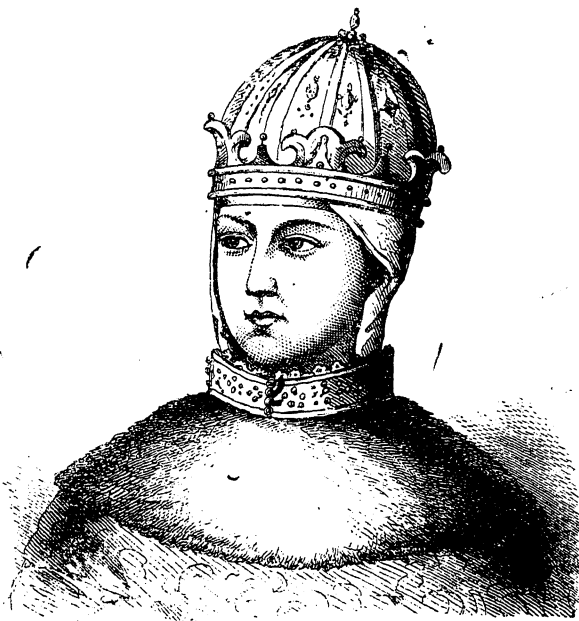
Царица Марья Никитишна Милославскихъ.