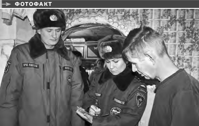
ПРЕСС-СЛУЖБА ГУ МВД РОССИИ ПО ИРКУТСКОЙ ОБЛАСТИ

Новогодние праздники в Иркутской области прошли относительно спокойно — с 25 декабря по 9 января в регионе произошло «всего» 182 пожара — на восемь случаев меньше, чем в прошлом году. Пожарные уверены, что это результат профилактической и разъяснительной работы: в преддверии Нового года государственными инспекторами по пожарному надзору проведено более 2 тысяч проверок, организовано 154 учебных эвакуаций.