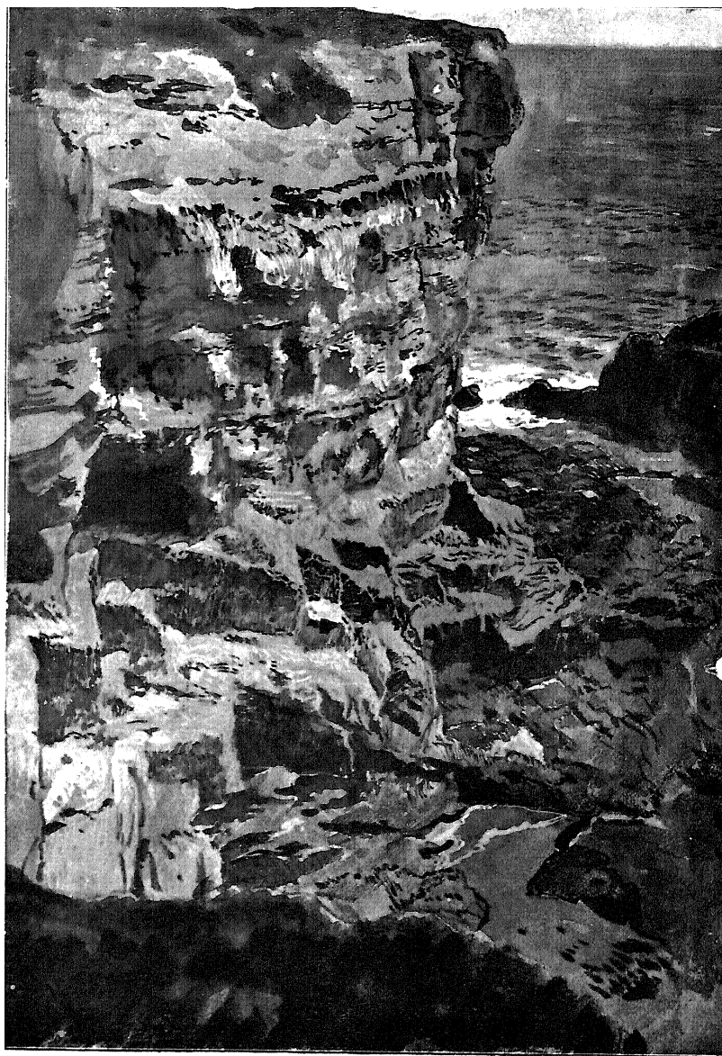
Скалы у Сиракузъ. Rochers dans les environs de Syracuse.