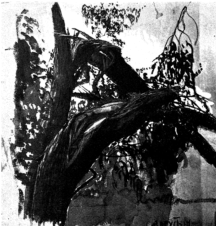
Этюдь яблони. Etude de pommier.