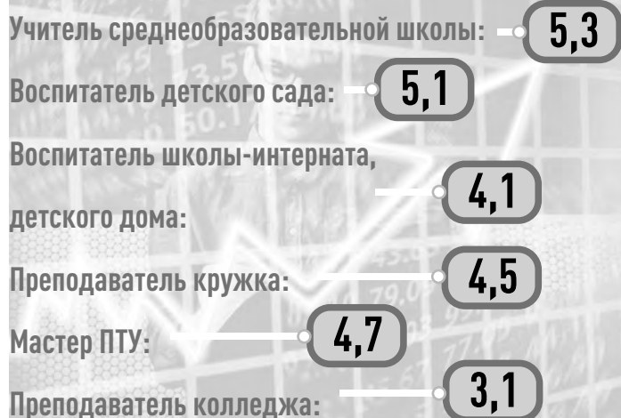
ИНФОГРАФИКА: ДЕНИС АКУРИН