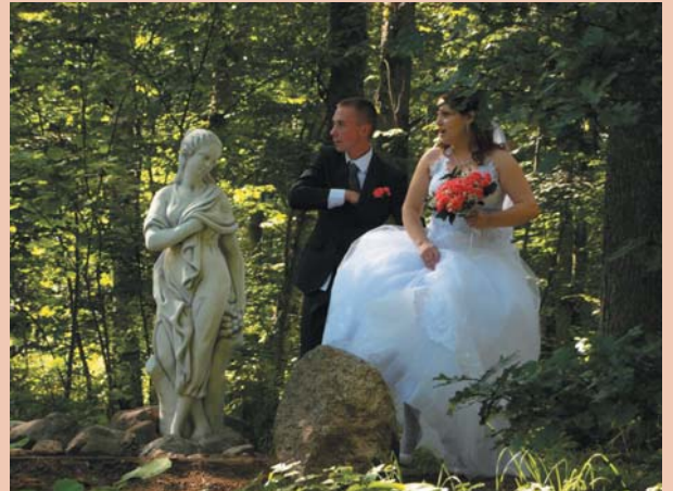
Новобрачные у красавицы Дорофеи