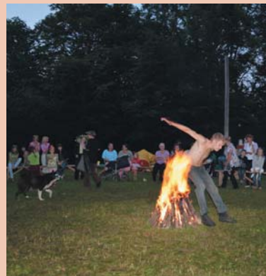
Очищение огнём в Купальскую ночь