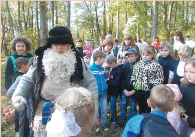
На поляне доброго Лешего