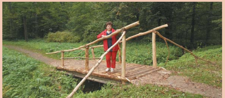
Мостик через ручей