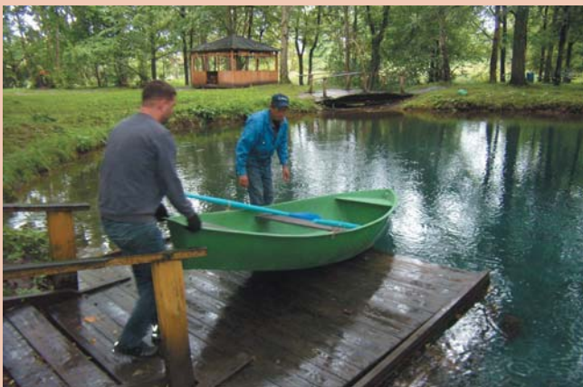
Испытание новой лодки