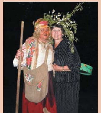
Неожиданная встреча в Купальскую ночь