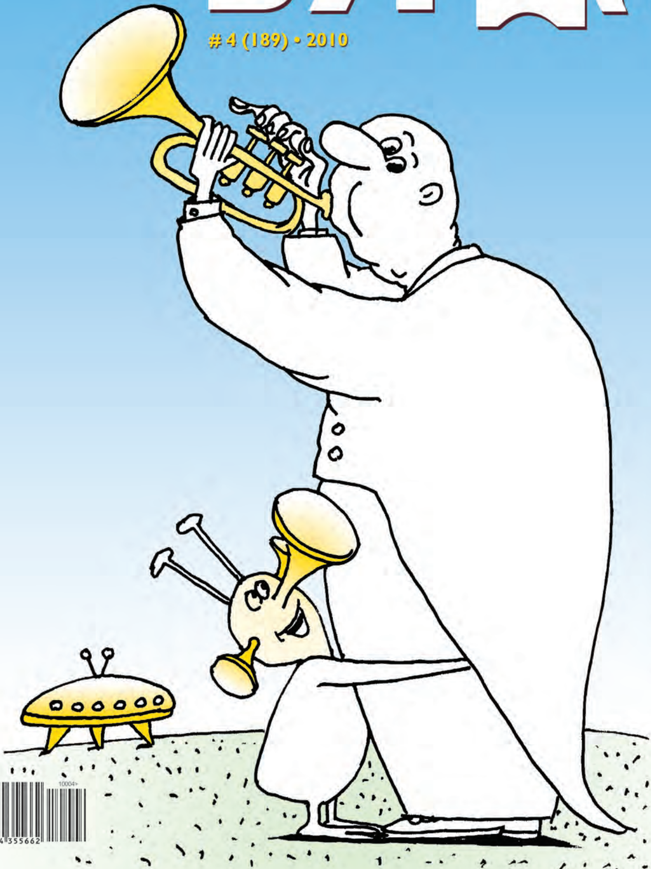
Рисунок Леонида Мельника