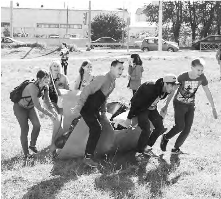
ПРЕСС-СЛУЖБА АДМИНИСТРАЦИИ Г. УФЫ

Уфимцы приняли участие в экологической акции «Сделаем!», приуроченной к Всемирному дню чистоты. Волонтеры собирали мусор в лесопосадках, на берегах рек и озер и других местах отдыха. Они сортировали бумагу, стекло, пластик и металл, а также ветки деревьев и крупногабаритный мусор, чтобы затем сдать на переработку.