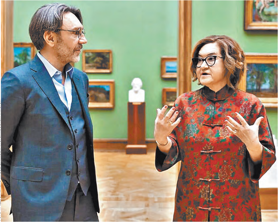
После 19 апреля побывать на экскурсии «Третьяковка со Шнуром» можно на онлайн-ресурсах ГТГ.