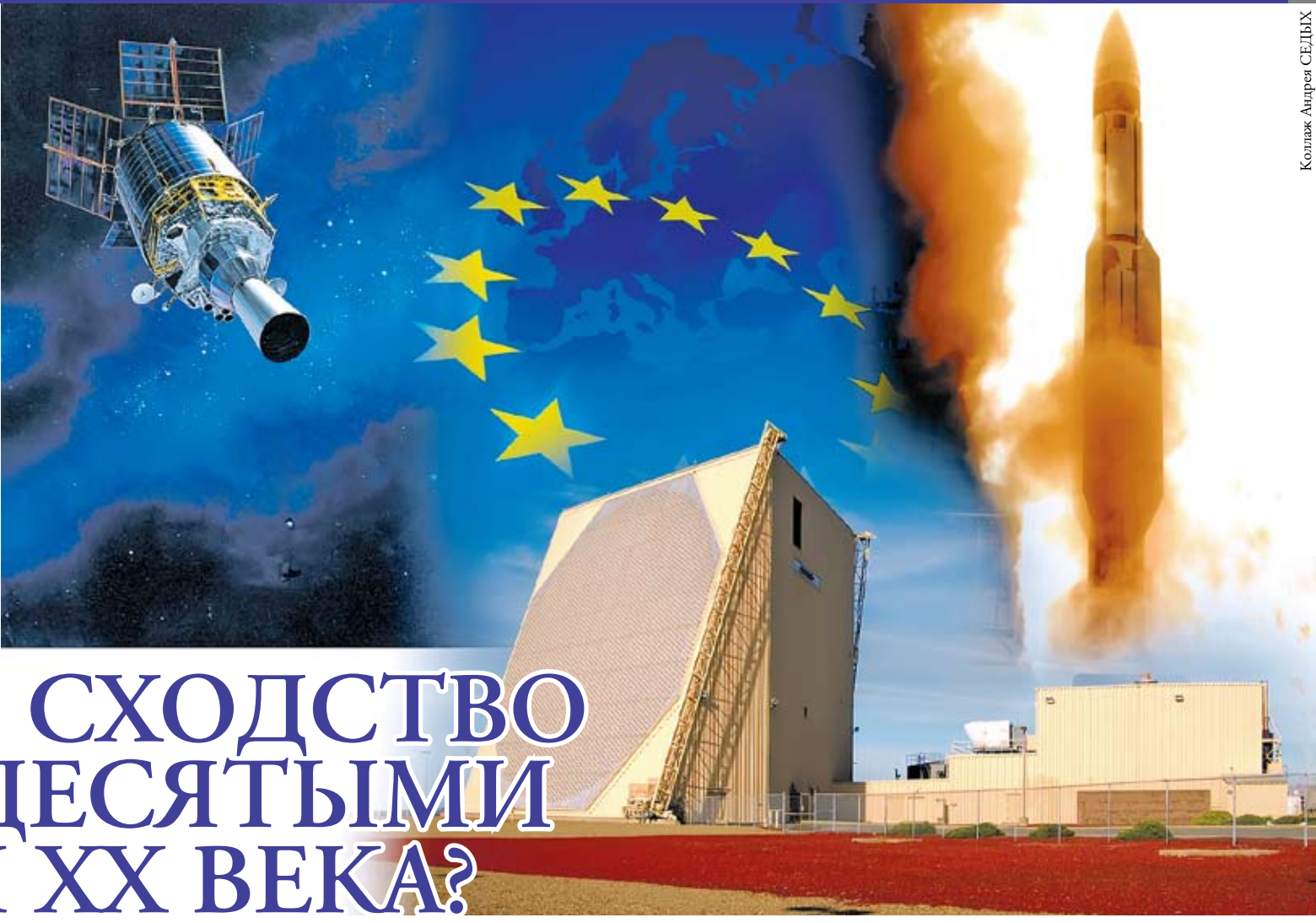
Коллаж Андрея СЕДУХ

И самое главное — мы ничем не можем подтвердить технически свои намерения о реализации так называемой секторальности. Единственная боеготовая российская система ПРО А-135 обладает весьма скромными возможностями и предназначена только