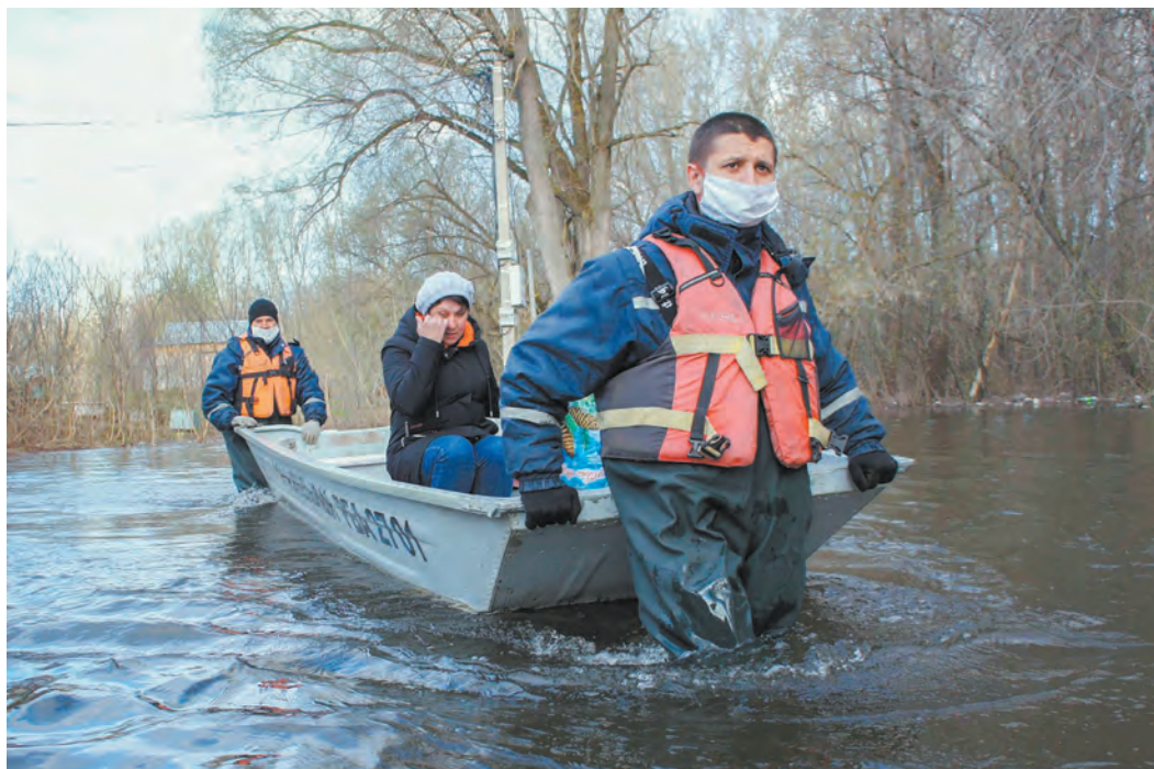
ПРЕСС-СЛУЖБА УПРАВЛЕНИЯ ГРАЖДАНСКОЙ ЗАЩИТЫ Г. УФА

На этой неделе в столице региона прогнозируют пик прохождения паводка