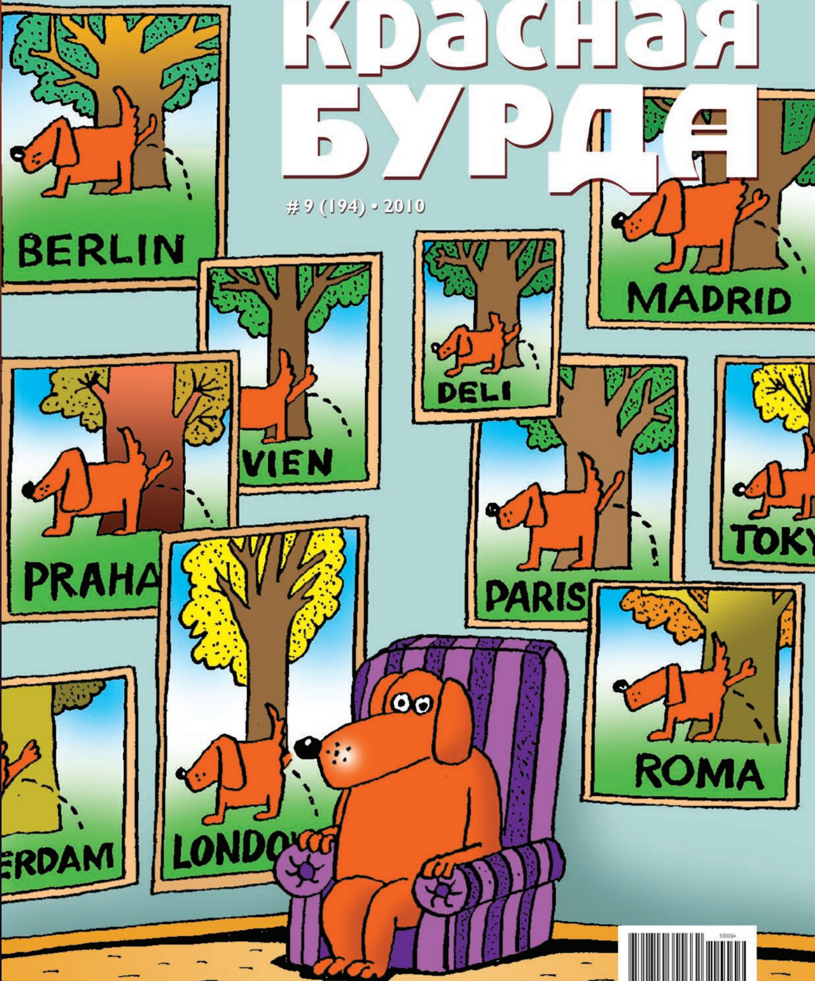
Рисунок Леонида Мельника