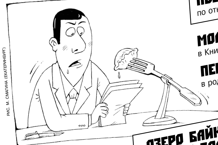
РИС. М. СМАГИНА (ЕКАТЕРИНБУРГ)

РОССИЙСКАЯ АРМИЯ в ближайшее время получит новые, СВЕРХТОЧНЫЕ УКАЗАНИЯ!