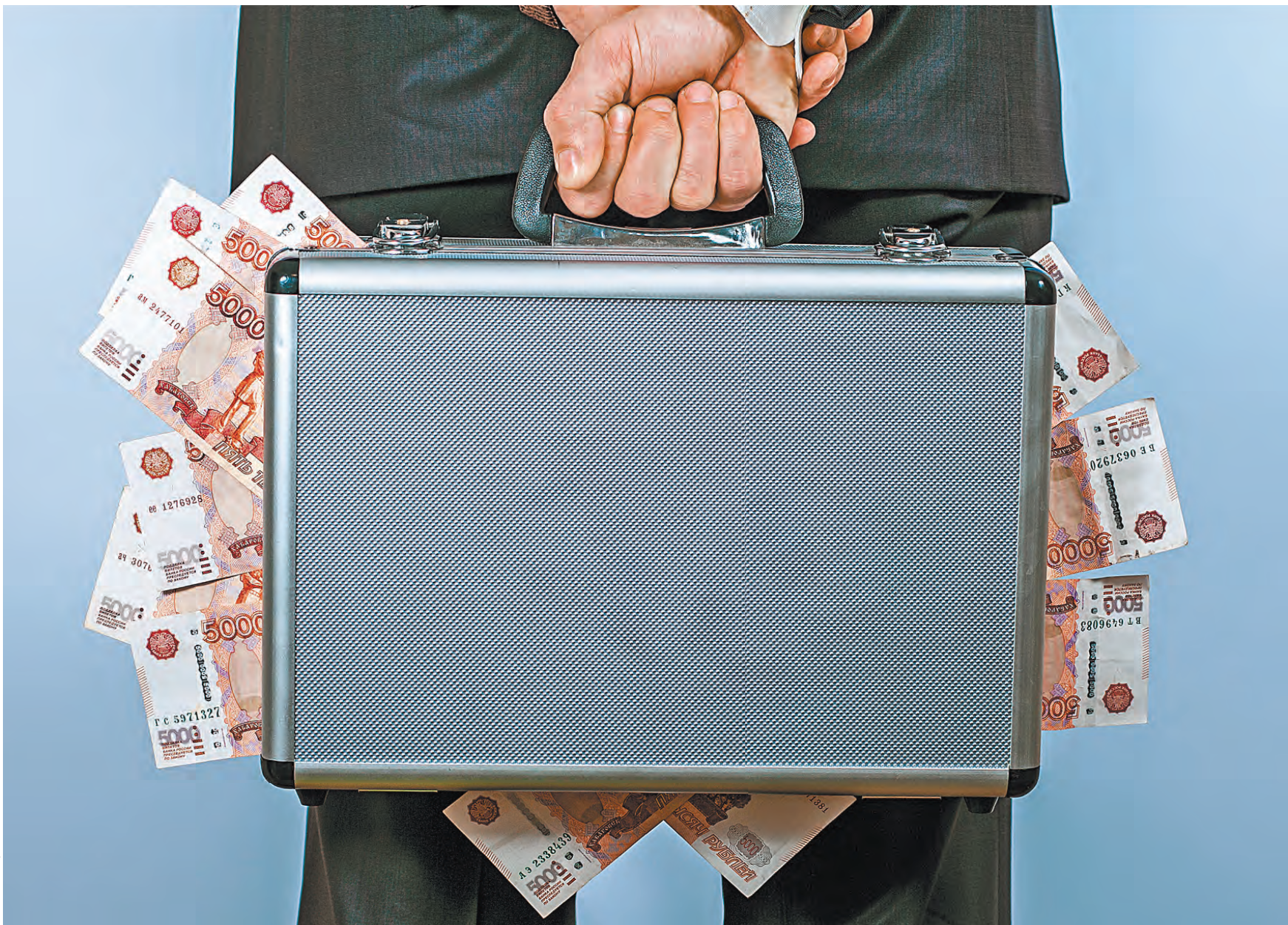
Если чиновник не сможет доказать, что записка в чемодане накоплена законно, деньги у него заберут.

Новые инициативы исправляют ситуацию. Председатель Государственной думы Вячеслав Володин некоторое время назад