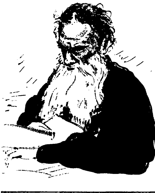
Л. Н. Толстой за работой. По рисунку И. Репина

До этого Толстой обличал современную культуру за бессердечность, за отсутствие жалости к человеку («Люцерн» написан в 1856 году, «Севастопольские рассказы» — несколько раньше). Но после смерти брата Николая Толстой ставит вопрос по-иному и глубже.