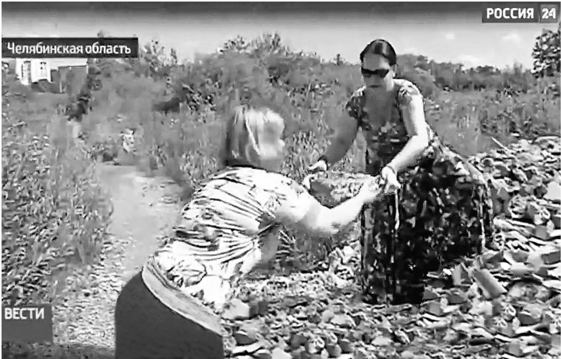
Ксения Дубичева, «Российская газета», Челябинск

Прокуратура выясняет, почему мэрия Челябинска выделила 45 многодетным семьям земельные участки посреди болота, втиснувшись между двумя железнодорожными ветками, по которым грохочут поезда.