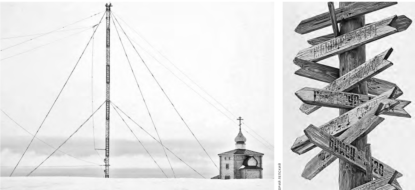
Около трети Арктики — российские земли. Здесь живут и работают наши люди. Отсюда до Москвы — всего четыре часа лету. А кажется, так далеко.