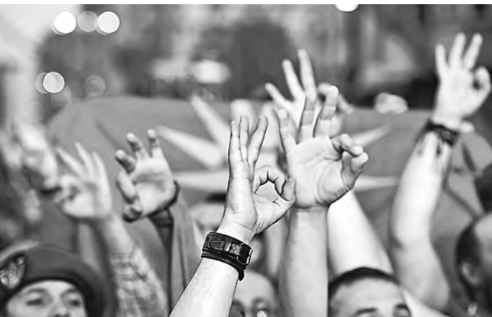
Сторонники премьера Груевского воздерживаются от критики властей.

Сторонники македонских властей считают, что оппозиция не предлагает ничего позитивного