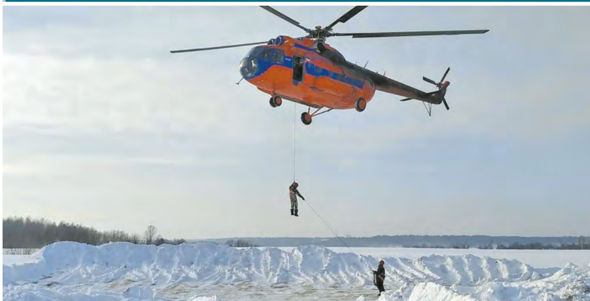
МИНИСТЕРСТВО ЛЕСНОГО ХОЗЯЙСТВА КРАСНОЯРСКОГО КРАЯ

В этом году в Красноярском крае защищать леса от пожаров будут более 450 бойцов лесного спецназа. Каждый авиопожарный обязан отработать навыки парашютных прыжков и выполнить по пять спусков с вертолета Ми-8. Вместе с ними сейчас тренируются также летчики-наблюдатели. Благодаря нацпроекту «Экология» обновлена и материально-техническая база лесопожарных формирований.