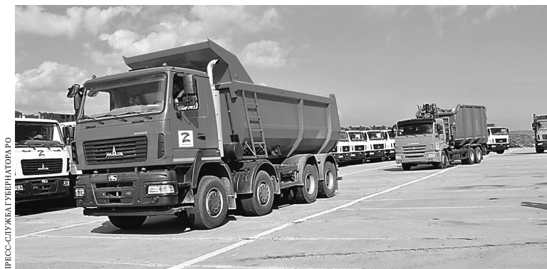
Спецтехника из России поможет навести в Мариуполе порядок.

— Только за три летних месяца Ростовская область направила жителям ЛДНР более 250 тонн гуманитарных грузов. Регион все это время активно принимал участие в помощи как людям, вынужденным покинуть республики и находящимся в пунктах временного размещения, так и самим сопредельным территориям. Весной донские аграрии помогли фермерам и личным подсобным хозяйствам ЛДНР посевным материалом. Считаю, что организации, которые нашли возможность поддержать соседей, показали достойный пример социально ответственного бизнеса.