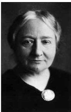
Эллен Кей (1849–1926) – шведская общественная деятельница, активистка движения за права женщин, охрану материнства и детства.