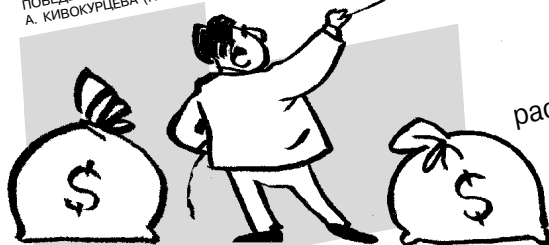
РИС., ИЛЛЮСТРИРУЮЩИЙ ПОВЕДЕНИЕ ДОЛЛАРА. А. КИВОКУРЦЕВА (ПЕРМЬ)