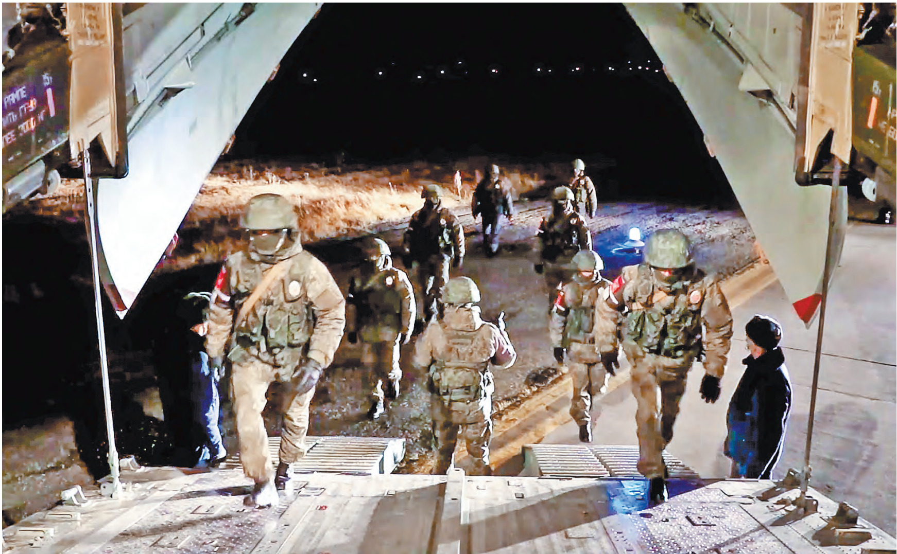
МИНИСТЕРСТВО ОБОРОНЫ РФ / ТАСС