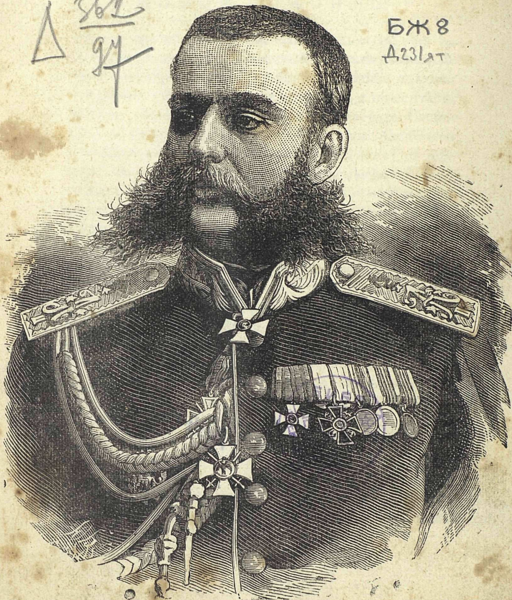
Генералъ Михаилъ Дмитріевичъ Скобелевъ.