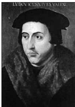
Хуан Луис Вивес