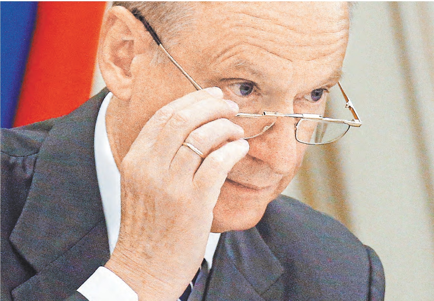
Николай Патрушев, Секретарь Совета безопасности РФ

В современном мире обеспечение безопасности государства и общества требует постоянной выработки многочисленных, нередко весьма сложных решений по вопросам организации обороны, военного строительства, функционирования оборонной промышленности, военно-технического сотрудничества, защиты конституционного строя, суверенитета и территориальной целостности. Сегодня, в условиях постоянно усложняющейся международной ситуации, принятие таких решений невозможно без комплексной экспертно-аналитической работы. Речь идет в первую очередь о подго-