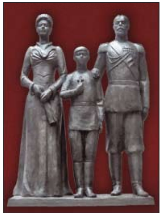
Император Николай II, императрица Александра Федоровна и цесаревич Алексей. Эскиз памятника