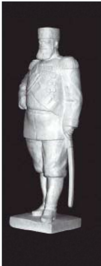
Император Александр III. Гипс. 2005 год