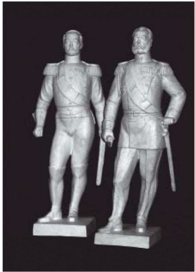
Императоры Николай I и Александр II. Гипс. 2005 год