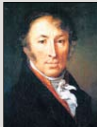
Основан Н. М. Карамзиным в 1791 году. Возобновлен в 1991 году

Литературно-художественный, историко-краеведческий ежемесячный журнал