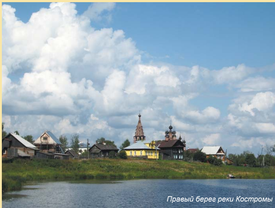
Правый берег реки Костромы