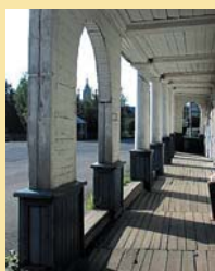
Архитектура деревянных торговых рядов