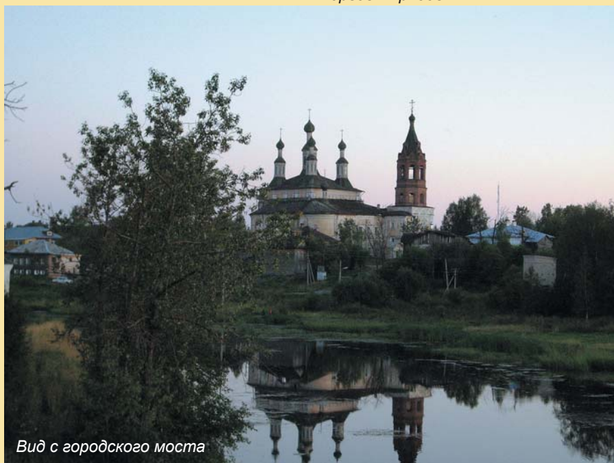
Вид с городского моста