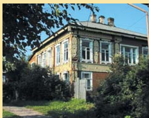
Дом купцов Шалаевых — старый дом с наличниками