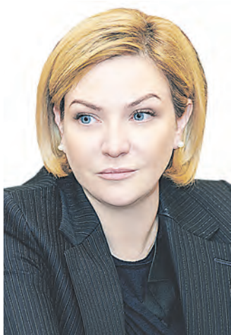
Ольга Любимова, министр культуры РФ:

Компенсацию части затрат, понесенных кинопроизводителями в крае, стали выплачивать в 2021 году. Тогда в региональный департамент инвестиций и развития малого и среднего предпринимательства на новую субсидию поступило десять заявок. По результатам отбора ее получили пять компаний, снявшие шесть кинокартин на общую сумму 19,16 миллиона рублей. В 2022 году поступило 22 заявки. 38,4 миллиона получили десять компаний на 19 кинокартин. Местных контрагентов, привлеченных к процессу, стало больше: если в позапрошлом году их было 58, то в 2022 году уже 242. ●