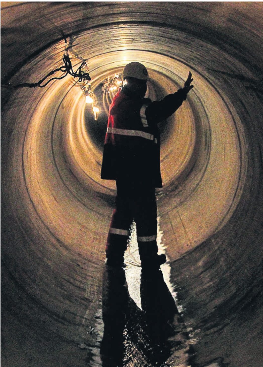
Впервые за 50 лет истории поставок российского газа в Европу возник реальный риск их полного прекращения

Европейские лидеры и крупные потребители единогласно отвергли эту идею, в большинстве своем посчитав ее нарушением действующих контрактов, где оплата в основном номинирована в евро и долларах. По данным „Ъ“, европейские компании также беспокоит, что покупка рублей может вынудить их взаимодействовать с ЦБ РФ, который находится под санкциями ЕС и США.