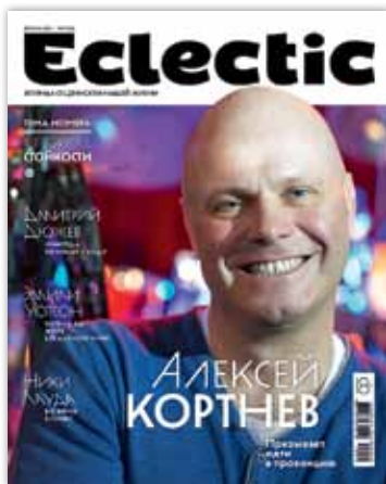
На обложке: Алексей Кортнев